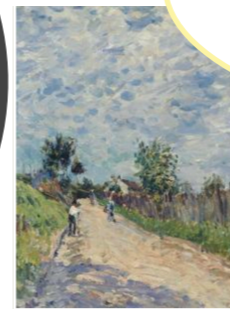
Alfred Sisley, Chemin montant, 1870 - Image © Lyon MBA - Photo EnDétail