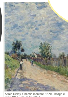
Alfred Sisley, Chemin montant, 1870